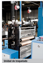
Unidad de troquelado