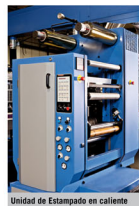
Unidad de Estampado en caliente

Como novedad mundial, la Brava incorpora el nuevo desarrollo de Unidad de Estampación en Caliente de última generación desarrollado con tecnología propia con ajuste de presión micrométrica, ofreciendo la máxima precisión y calidad de estampación. Con tiempos de cambios de trabajo inmejorables, el sistema ofrece la posibilidad de trabajar con plancha de magnesio y economizador de foil. El sistema conserva el concepto de robustez propio de todos los equipos de Rotatek.